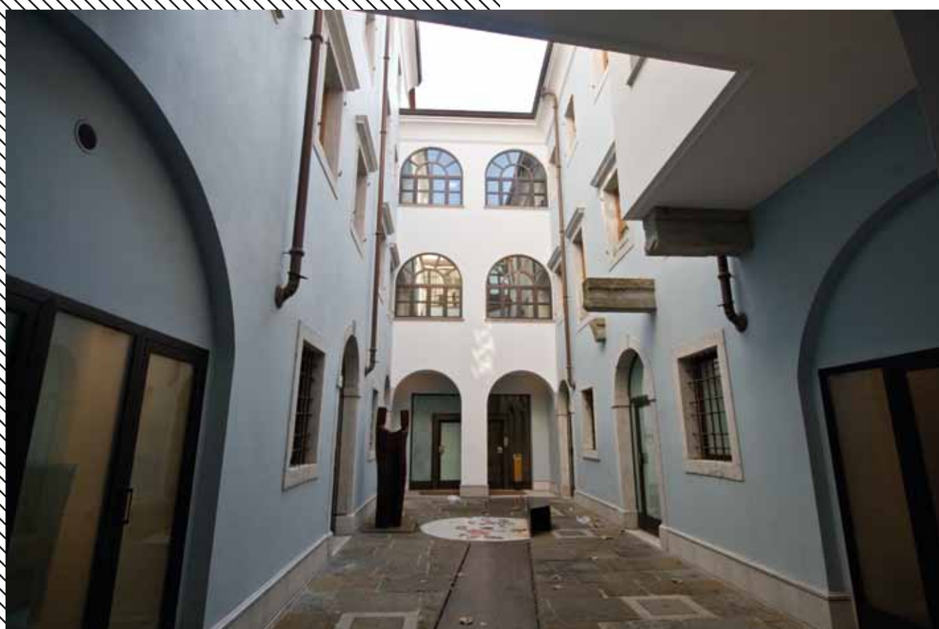
Ingresso, corte interna, via Cavana 14, Trieste