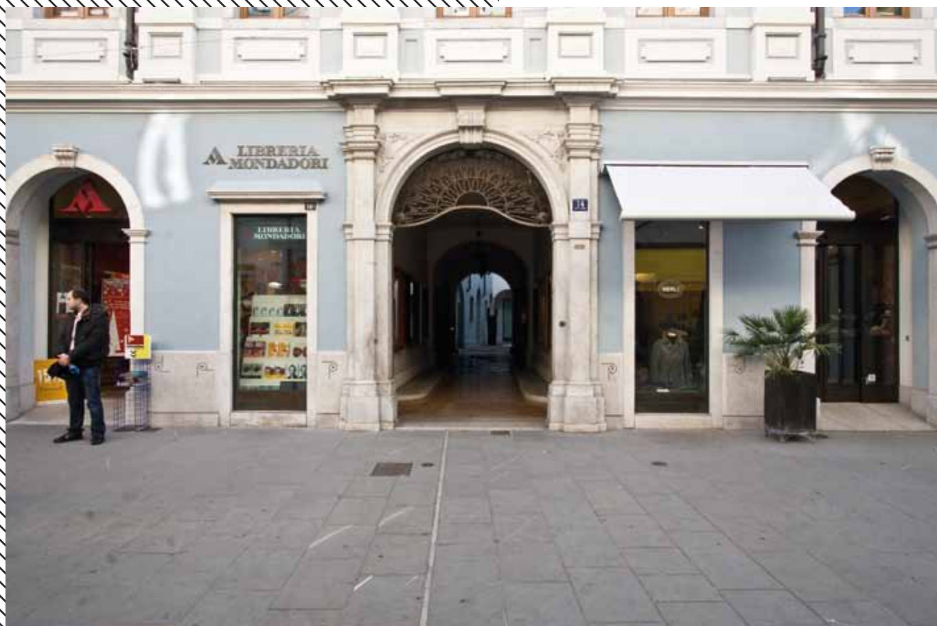
Ingresso, via Cavana 14, Trieste