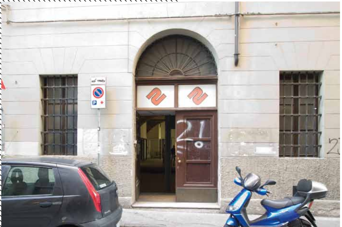
Ingresso, Via Madonna del Mare 3a, Trieste