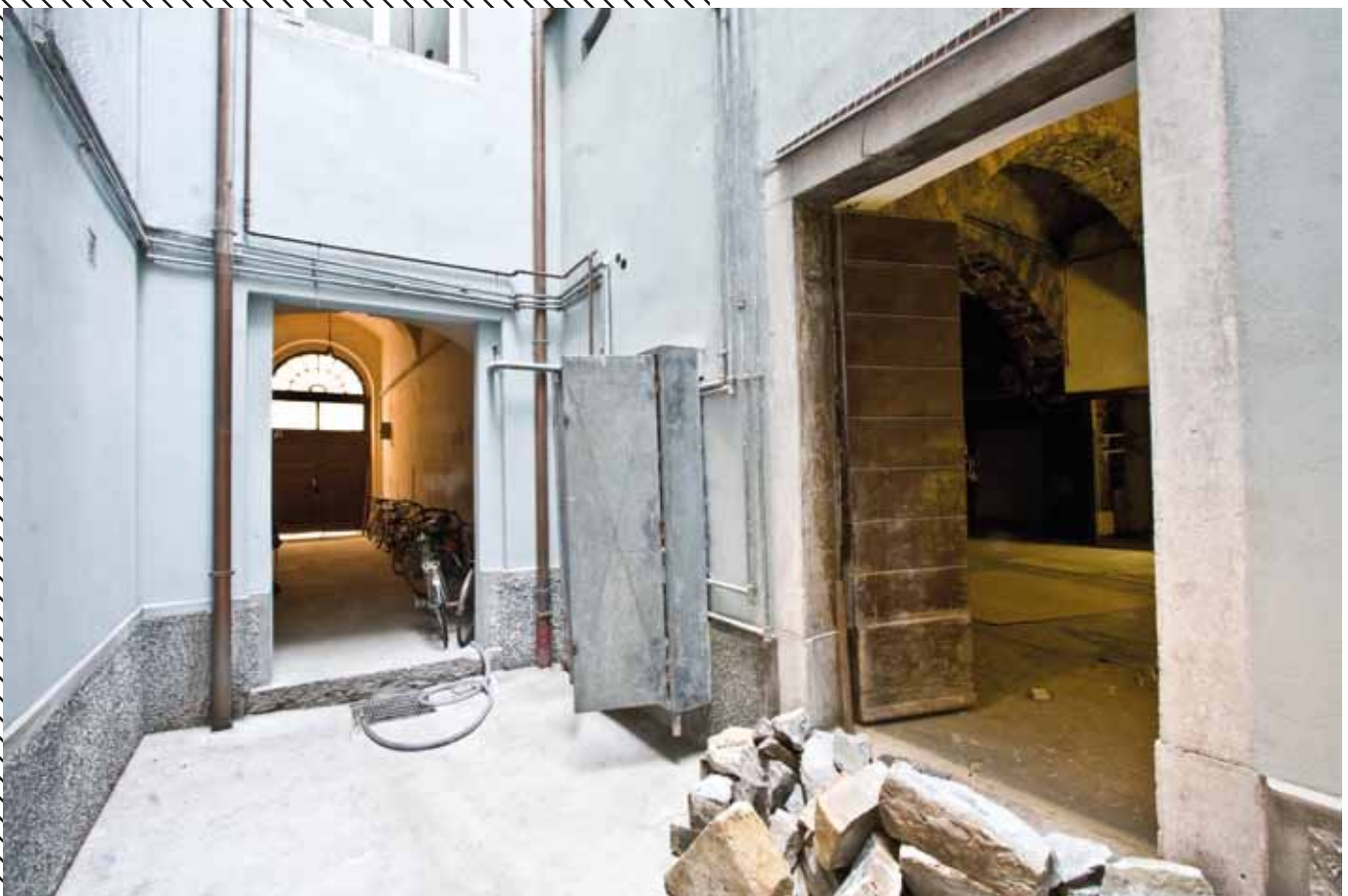
Corte Interna, Via Madonna del Mare 3a, Trieste