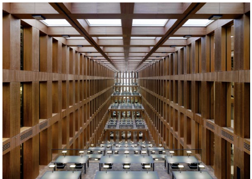
sopra e in apertura/above and opening page: "Jacob-und-Wilhelm-Grimm-Zentrum" Biblioteca universitaria centrale della Humboldt-Universität/ Central university library of the Humboldt-Universität, Berlino, 2004-2009