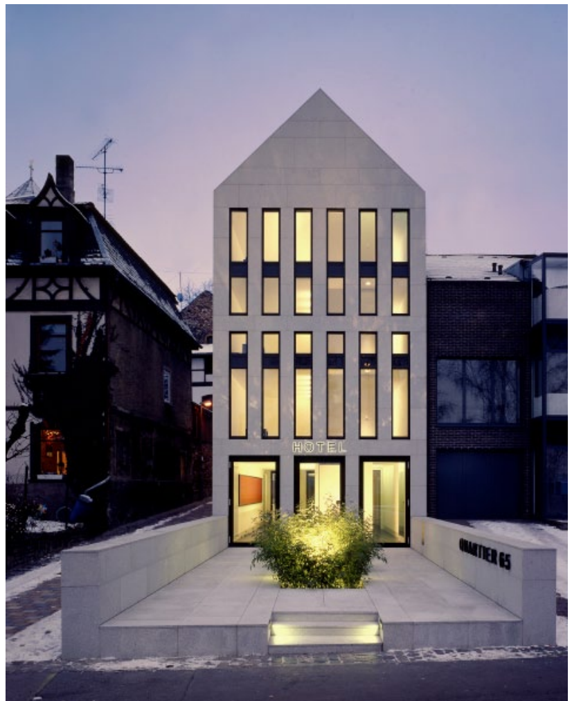
Hotel "Quartier 65", Mainz (D), 1997-2001