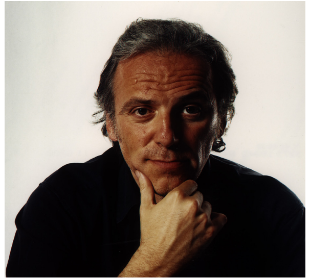
immagine Enrico Basili per Dogma

Massimo Iosa Ghini (Bologna, Italia, 1959), di formazione designer e progettista, è una figura di intellettuale “a tutto tondo”. Considerato uno dei professionisti italiani di maggiore rilievo nel panorama internazionale, Iosa Ghini ha maturato nel tempo una visione di progetto “trasversale” concepito per una società in continua evoluzione, in cui design di prodotto e progetto architettonico si integrano e si arricchiscono a vicenda. Attraverso un visibile talento figurativo, Iosa Ghini persegue un linguaggio espressivo fortemente influenzato dalle sue radici culturali – che affondano nel fumetto e nella grafica – a cui affianca poi un solido impegno in materia di eco-sostenibilità. Iosa Ghini ha studiato architettura a Firenze per poi laurearsi al Politecnico di Milano. Dal 1985 partecipa alle avanguardie dell’architettura e del design italiano: fonda il movimento culturale “Bolidismo” ed entra a far parte del gruppo “Memphis” con Ettore Sottsass. Alla fine degli anni Ottanta apre lo studio “Iosa Ghini Associati”, con sede a Milano e Bologna. Tiene conferenze in varie Università, tra le quali il Politecnico di Milano, la Domus Academy, l’Università Sapienza di Roma, la Scuola Elisava di Barcellona, Design Fachhochschule di Colonia e la Hochschule für Angewandte Kunst di Vienna. È docente dal