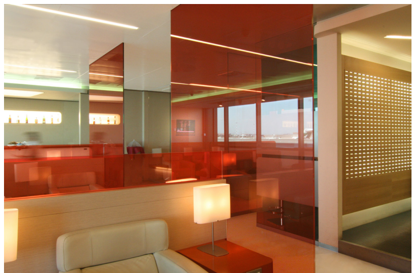
Alitalia, Club Freccia Alata, Italia, dal/since 2006