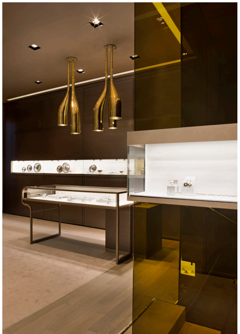
Faraone, Milano (I), 2010