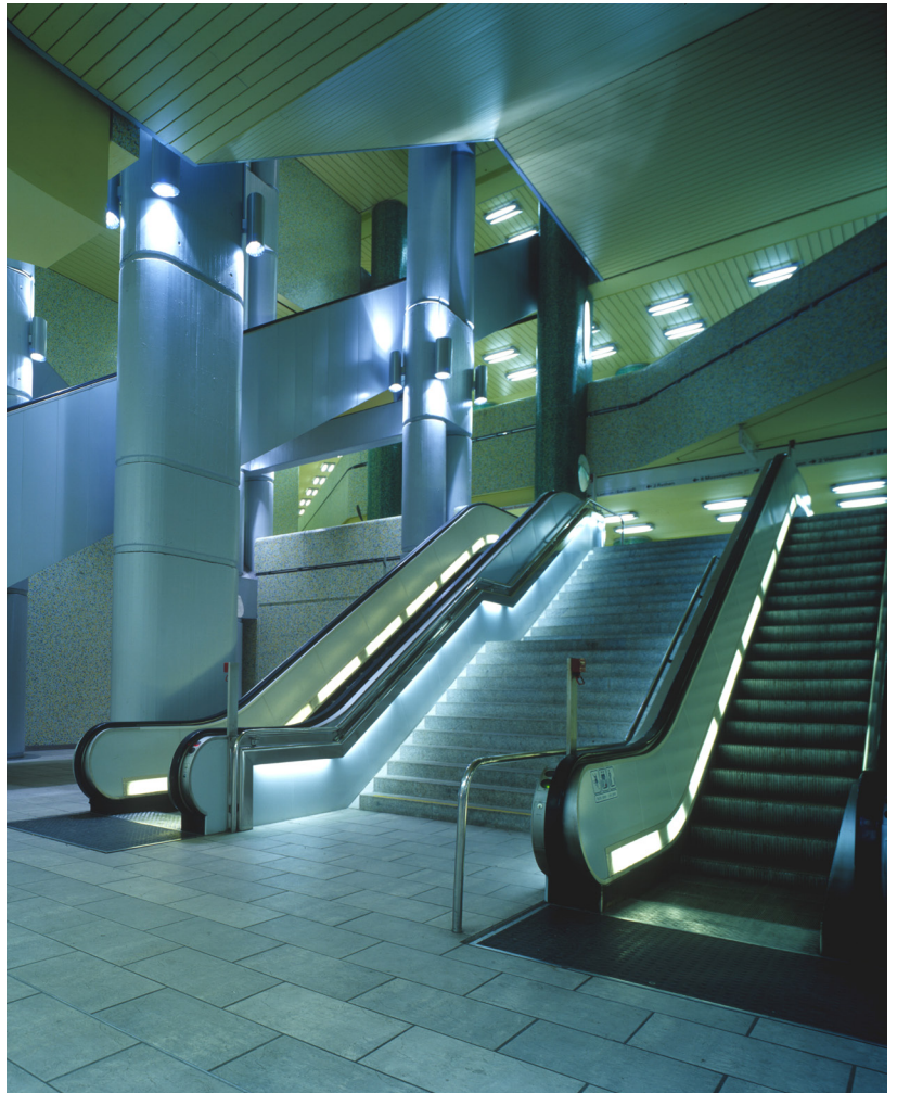
Üstra Public Transport, Stazione Metropolitana Kröpcke/ Kröpcke Metro Station, Hannover (D), 2000