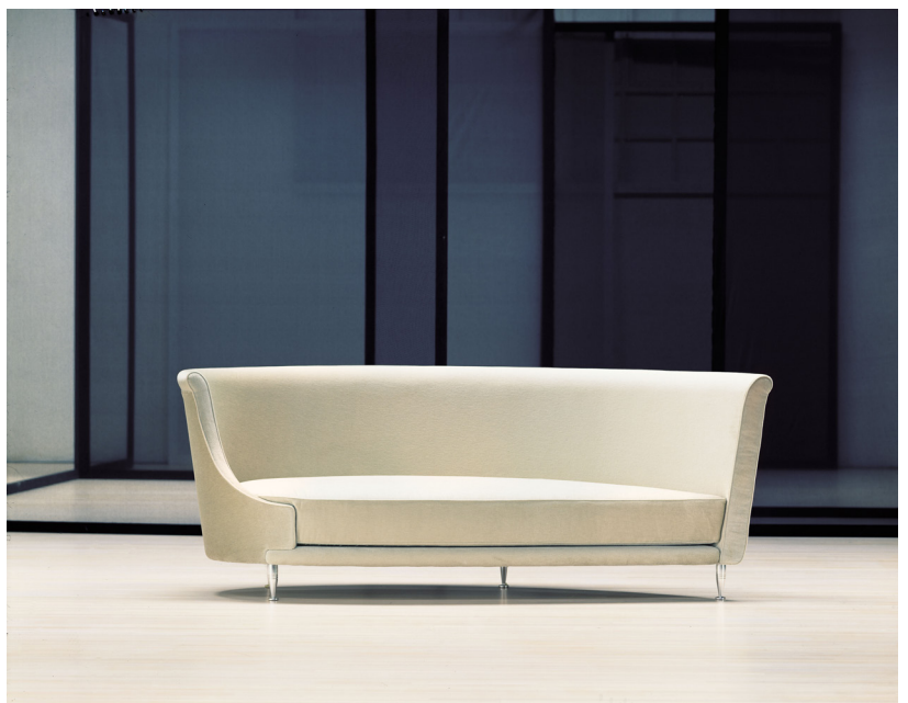
Moroso, Collezione Newton, sofa, 1989