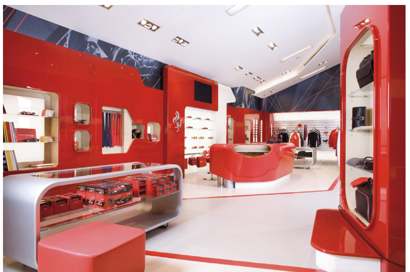
sopra e in apertura/above and in the opening page Ferrari Factory Store, Serravalle Designer Outlet, Serravalle Scrivia (AL), 2009