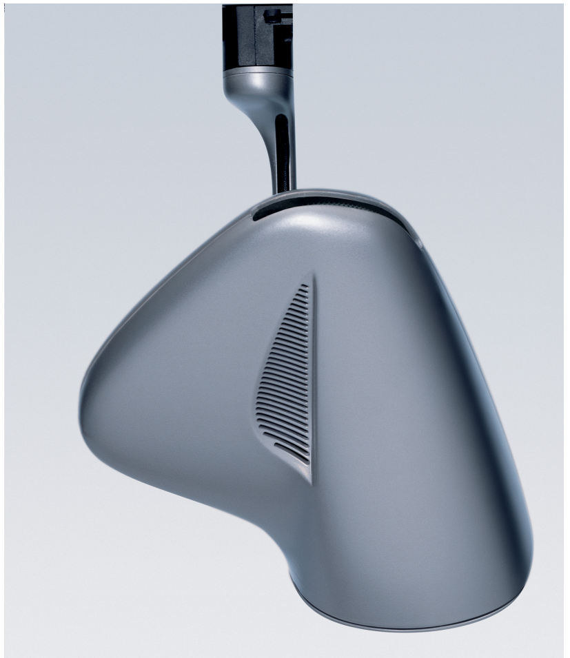
Zumtobel, Solar II, faretto, 2004