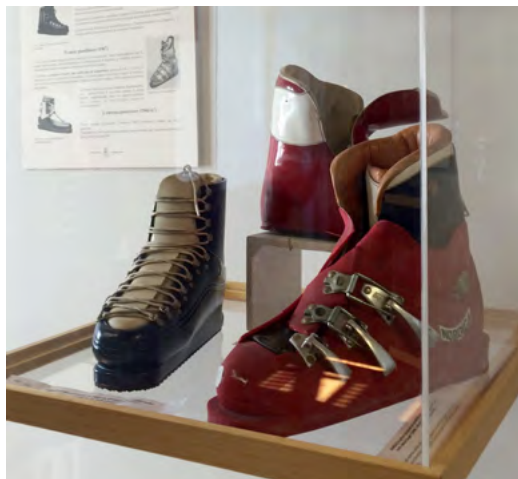
02 Primo scarpone in plastica per colata, Bob Lange (Usa), 1964, primo scarpone in poliuretano iniettato, Nordica, 1968, Museo dello Sportsystem Montebelluna, 2016

Parte di queste riflessioni sono state sviluppate all'interno di un progetto condotto dall'Università Iuav di Venezia incentrato sul rilancio del Museo dello scarpone e della