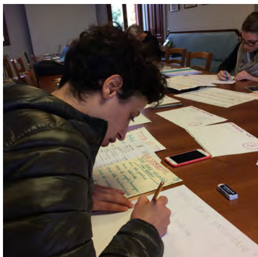
06 Workshop tenuto da Università Iuav, concept per la mostra Le scarpe dei campioni , Montebelluna, 2016

Diverse sono infatti le attrattività presenti sul territorio, considerato in senso esteso: dai centri storici di Asolo e Possagno alla villa progettata da Andrea Palladio a Maser, alla tomba Brion di Carlo Scarpa a San Vito di Altivole o alla Tipoteca Fondazione Italiana a Cornuda. Allo stesso tempo, la zona si offre per la pratica di un'ampia varietà di attività sportive, in particolare nell'ambito podistico e del ciclismo, che vedono come punto di partenza il Montello, con estensione dei percorsi fino al monte Grappa. In totale nel 2016 sono state calendarizzate settantuno fra