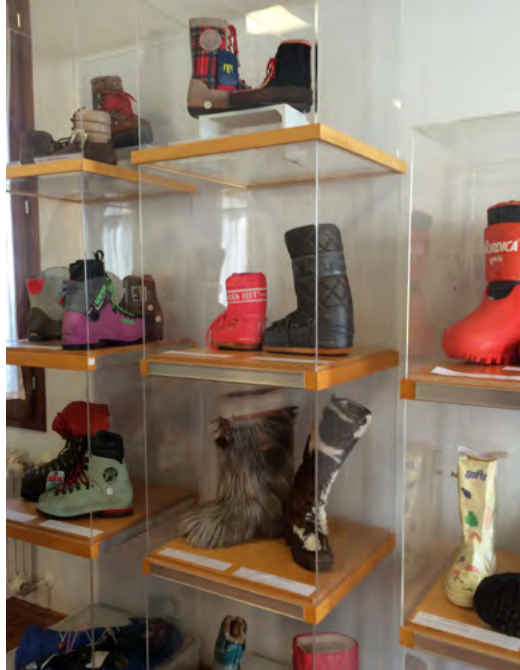
Sala sulla diversificazione produttiva anni Ottanta-Novanta, Museo dello Sportsystem Montebelluna, 2016

Di converso però, la recente crescita di attenzione verso i significati dei prodotti e di conseguenza verso i caratteri peculiari delle realtà che li esprimono, in quanto fattori di identità e di distinzione nel panorama internazionale e non replicabili altrove, porta con sé anche un possibile e rinnovato ruolo per musei distrettuali come nuclei di riagggregazione e riorganizzazione dei soggetti sviluppatasi intorno ad essi. Accanto a compiti culturali più consolidati, come la conservazione ed esposizione delle testimonianze storiche, queste strutture possono infatti svolgere funzioni più articolate, sintetizzabili da un lato nelle attività formative legate alle trasmissioni di conoscenze e abilità tipiche del territorio, anche con l'obiettivo di innovarne logiche e risultati, dall'altro nel diventare i collettori di operazioni di potenziamento dell'attrattività territoriale sia rispetto a nuove imprese sia in chiave turistica (Girardi, 2017).